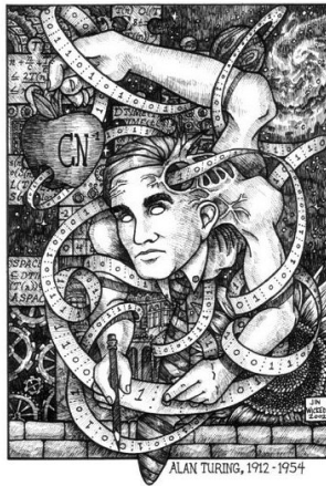
Figure 2 : “Universal Turing Machine”, ©2003, Jin Wicked [7].