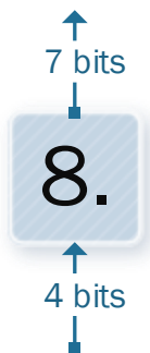
Figura 2 - Entradas e saídas do módulo de conversão de binário para sete segmentos

(hexadecimal), portanto a unidade de conversão deve ter 4 sinais de entrada, correspondente às entradas em binário e 7 saídas, correspondentes aos 7 segmentos do display , como mostra a Figura 2.