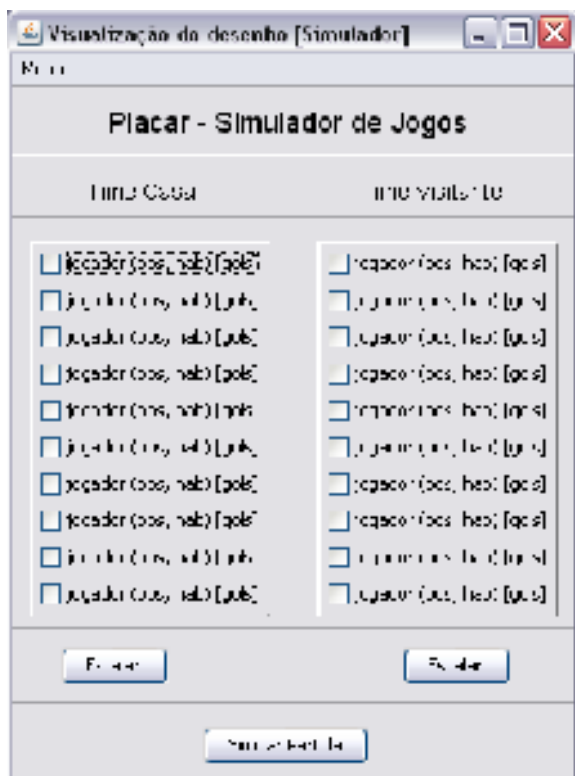
Tela 1 – Simulador de Jogos