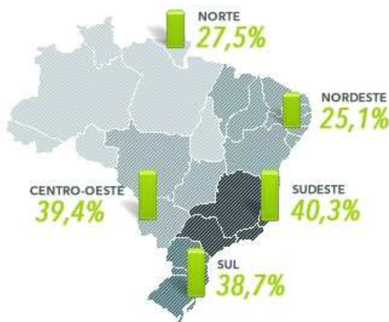
PERCENTUAL DE PESSOAS QUE USARAM A INTERNET EM 2008 NA POPULAÇÃO ACIMA DOS 10 ANOS

Em 2008, 56 milhões de pessoas usaram a internet, o que corresponde a 34,8% da população acima dos 10 anos. Em relação a 2005, houve um crescimento de 75,3%.