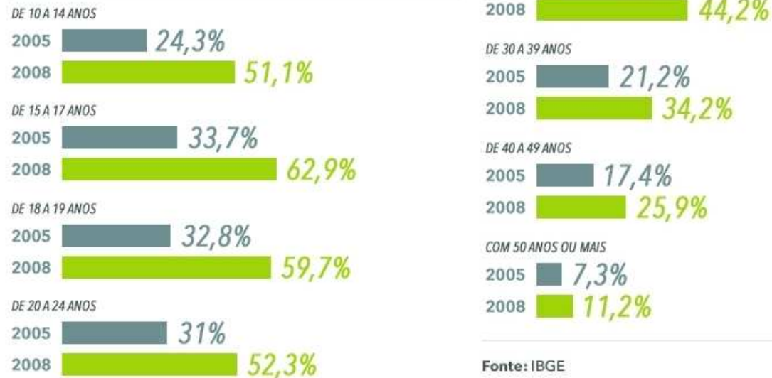
Figura 1.2 – Percentual de pessoas que usaram a internet em 2008 na população acima dos 10 anos, por idade.

De acordo com outra pesquisa [2], conforme o gráfico abaixo (Figura 1.3), os adolescentes são as pessoas que mais acessam páginas web. Eles acessam cerca de 2500 páginas por mês, mostrando que eles têm interesse e muita curiosidade, uma vez que na internet é possível encontrar assunto de todos os temas. Isso significa que a internet para o adolescente é um atrativo, no qual ele pode explorar e descobrir novas coisas, seja para lazer, informação ou comunicação.